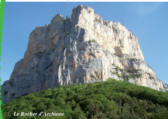
Le Rocher d'Archiane

A la Révolution, le découpage en départements sépare les terres des deux versants du col, et la commune de Treschenu est créée.