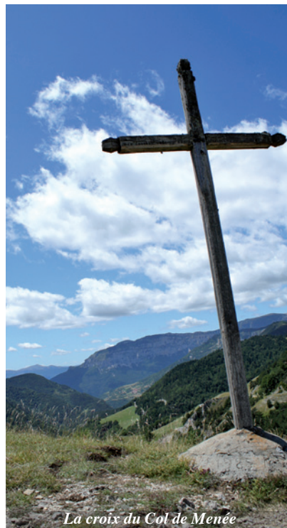
La croix du Col de Menée

Ce col fut toujours un lieu de passage, probablement équipé d'une route dès l'époque romaine. Les muletiers, au Moyen Age, apportaient en Trièves les outres de vin de Die et ramenaient au retour leurs montures chargées de céréales, de textiles, de