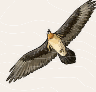
B - aigle royal

Aide-toi des illustrations ci-dessous pour trouver de quelle espèce il s'agit :