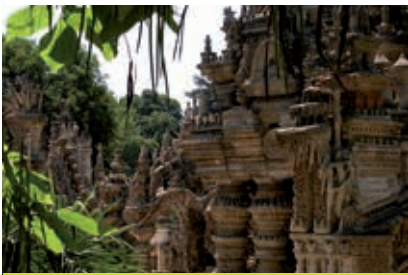
Palais idéal du Facteur Cheval (Hauterives)

sur le Vercors et le Rhône. Après Chantermerle-les-Blés, marqué par sa remarquable église romane, il bascule vers la vallée bucolique de l'Herbasse et ses paysages de sables. L'itinéraire traverse Saint-Donat, où vous pourrez découvrir sa collégiale, puis il longe le Lac de Champos pour rejoindre la forêt de Chambarans, riche de ses nombreuses essences, de sa faune et de ses zones humides. Puis, de Roybon, en Isère, la boucle surplombe la vallée de la Galaure, pour arriver à Hauterives où vous pourrez visiter le Palais Idéal, chef d'œuvre de l'art brut. Enfin elle rejoint Saint-Vallier après avoir profité du magnifique point de vue sur la Drôme des Collines et le Vivarais.