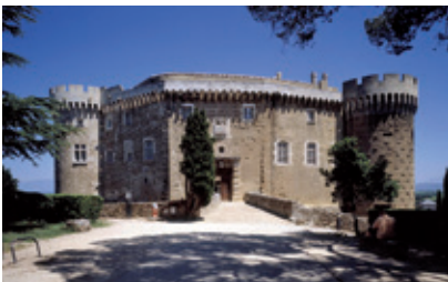
Château de Suze-la-Rousse

Glacière. Suivre la D251, vous passerez à proximité du village de Bouchet. Prendre à droite la D141, puis tourner à gauche pour récupérer la D251. Tourner à droite sur le chemin de l'Abourin en suivant le canal du Moulin vous passerez derrière l'ancienne papeterie de Tulette avant d'arriver au centre du village. Faire le tour du rempart et entrer dans la vieille ville.