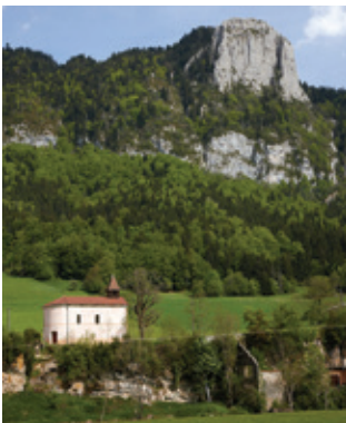
Saint-Agnan-en-Vercors chapelle de la Britière

Patrimoine d'exception, classé Parc naturel régional depuis 1970, le cœur de Vercors ne ressemble à aucun autre territoire : une nature sublime, une richesse exceptionnelle tant au niveau de ses reliefs que de sa faune, de sa flore, de son patrimoine bâti ou de son histoire en font un espace unique à découvrir à vélo.