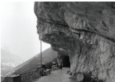
Travaux dans les Grands Goulets au début du 20 e siècle

Spectaculaires et audacieuses, les routes du Vercors ont été construites au 19 e siècle au prix d'efforts considérables. Désenclavant le massif, permettant le lien entre le piémont et le plateau du Vercors, elles doivent leur célébrité à leurs tracés impressionnants taillés au flanc des falaises ou au fond des gorges.