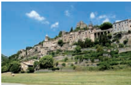
Village de Montbrun-les-Bains

Ce circuit vélo au profil altimétrique clément vous emmènera à la découverte de trois vallées du berceau historique des Baronnies provençales. Après un départ permettant de gagner rapidement le col de Macuègne (alt 1068 m), vous plongerez sur le village de Barret-de-Lioure et la vallée de Montbrun-les-Bains. Quelques lacets de route plus loin, vous rejoindrez Montbrun-les-Bains réputé tant pour ses thermes que pour la beauté de son village médiéval. Vous filerez ensuite direction nord par la route des gorges du Toulourenc, saluerez les créneaux du château d'Aulan avant de gravir le petit col du même nom. C'est enfin sous les vestiges perchés de l'ancien fort des barons de Mévouillon que vous continuerez votre